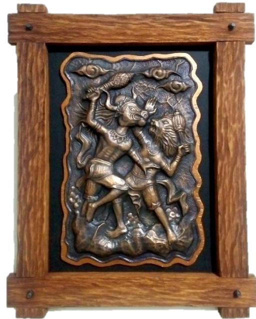
Gambar 12 "Unjuk Ilmu Kanuragan" (Dokumentasi Penulis,2017)

Pendiskripsian karya kedua dengan judul "Unjuk Ilmu Kanuragan" karya ini menceritakan kelanjutan cerita legenda gunung Kelud pada karya pertama. Adegan dalam karya kedua ini menggambarkan tentang adegan pertarungan kedua tokoh yaitu Lembu Suro dan Jhata Suro. Pertarungan tersebut ditengarahi karena adanya sayembara yang diadakan oleh Dewi Kilisuci dengan mengundang para raja di Nusantara untuk beradu ilmu kanuragan, siapa menjadi terkuat akan dijadikan suaminya. Namun ketika sayembara itu terjadi para raja Nusantara mengalami kekalahan dan mati ditangan Lembu Suro dan Jhata Suro, akhirnya tersalah dua saudara disayembara tersebut.