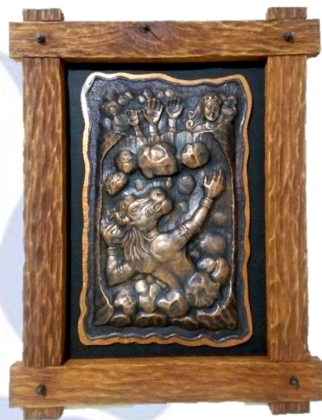
Gambar 15 "Kau Kubur Aku" (Dokumentasi Penulis, 2017)

Pendeskripsian karya ke lima dengan judul "Kau Kubur Aku" Menceritakan tahap akhir dari cerita legenda gunung Kelud yaitu dalam adegan penguburan lembu suro. Penguburan itu dilakukan oleh Dewi Kilisuci dengan menyuruh prajurit-prajuritnya. Cerita ini berawal dari sayembara yang diadakan oleh Dewi Kilisuci yang yang berniat mencari suami. Ternyata sayembara itu dimenangkan oleh Lembu Suro dengan terbunuhnya Jhata Suro dan para raja di Nusantara. Mengetahui bahwa Lembu Suro yang menjadi pemenang, Dewi Kilisuci yang pada dasarnya tidak menyukainya akhirnya memberi tantangan untuk membuat sumur yang berbau wangi di atas gunung hanya dalam waktu semalam sebelum ayam berkokok di keesokan hari, dan disangka Lembu Suro mampu menyelesaikannya.