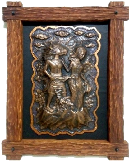
Gambar 13 "Jangan"

Diskripsi karya ketiga dengan judul "Jangan" mengambil penggalan dari cerita legenda gunung Kelud dengan tema penolakan. Karya ini bersangkutan dengan karya kedua dengan judul "Unjuk Ilmu Kanuragan" Yang mengambil adegan pertarungan dan menyebabkan Jhata Suro terbunuh ditangan Lembu Suro. Kembali pada apa yang disampaikan Dewi Kilisuci pada sayembara "bahwa siapa jadi yang terkuat akan dijadikan suaminya" akhirnya Lembu Suro lah yang menjadi pemenang dalam sayembara tersebut. Namun saat lembu suro melamar ternyata Dewi Kilisuci tidak menyukainya karena lembu Suro memiliki sosok manusia berkepala lembu atau sapi.