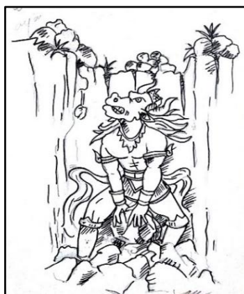
Gambar 9 “Tega Kau”