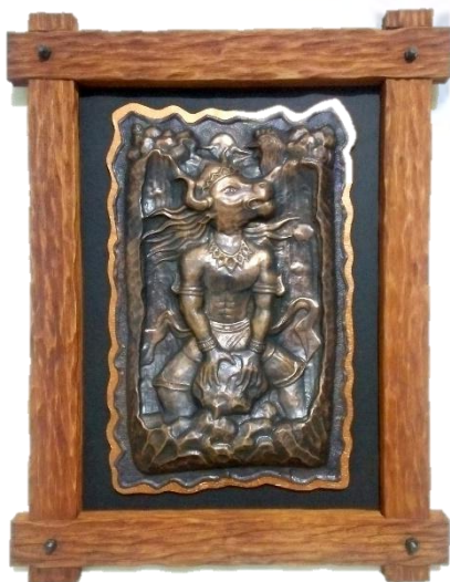
Gambar 14 "Tega Kau" (Dokumentasi Penulis, 2017)

Pendiskripsian karya ke empat dengan judul "Tega Kau" Menceritakan tentang Lembu Suro yang menjalankan tantangan yang diberikan oleh Dewi Kilisuci kepada Lembu Suro, jika tantangan itu berhasil maka Dewi Kilisuci rela diperistri Lembu Suro. Tentunya tantangan itu bukan tanpa syarat, Lembu Suro harus membuat sumur diatas gunung kelud sampai tujuh batas pandangan dengan syarat harus diselesaikan satu malam sebelum ayam jago berkokok dan sumur haruslah berbau wangi. Tantangan itulah yang diberikan Dewi Kilisuci bertujuan agar Lembu Suro tak sanggup melakukannya dan pada akhirnya lamaran itu batal.