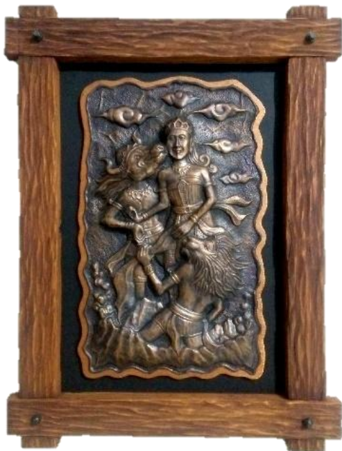
Gambar 11 "Pilihlah Aku"

Pendeskripsian karya pertama dengan judul "Pilihlah Aku" Diambil dari penggalan tahap awal cerita legenda gunung Kelud dimana karya ini menggambarkan adegan merayu, adegan ini bermula ketika keinginan Dewi Kilisuci untuk mendapatkan suami. Tergambarkan dengan tiga