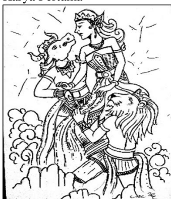
Gambar 6 “Pilihlah Aku”