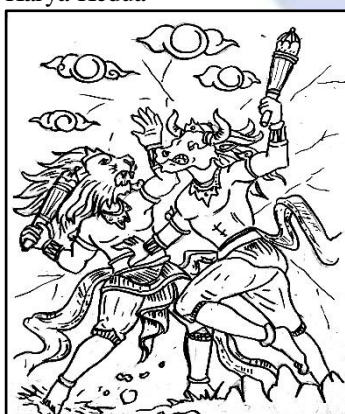
Gambar 7 “Unjuk Ilmu Kanuragan”